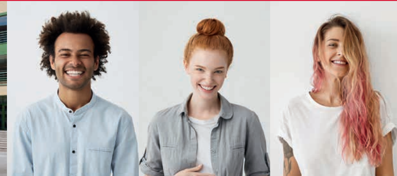
Campus Lichtenberg Alt-Friedrichsfelde 60, 10315 Berlin